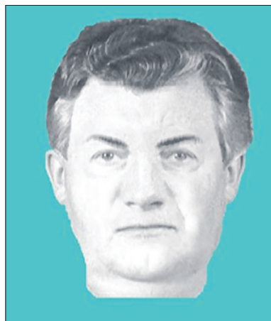
De gezochte man anno 2011.