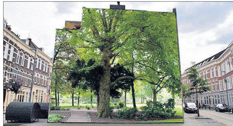
De foto van de boom in het Oude Westen.